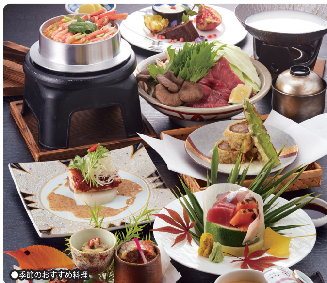
●季節のおすすめ料理

■瀬戸内の新鮮な魚料理を中心とした美味しい料理を、落ち着いた雰囲気の中でごゆっくりと味わっていただけます。