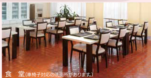
食堂(車椅子対応の洗面所があります。)