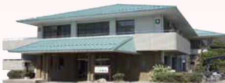
愛媛県障がい者更生センター

上記メニューは、ほんの一例です。 施設の皆様のご希望により、 如何ようにもご準備いたします。 お気軽にご相談ください。